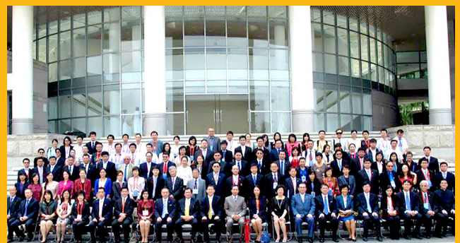
ตัวแทนนักวิชาการไทย-จีนที่เข้าร่วมงานสัมมนายุทธศาสตร์ไทย-จีน ครั้งที่ 4 ณ เมืองเซี่ยเหมิน มณฑลฝูเจี้ยน